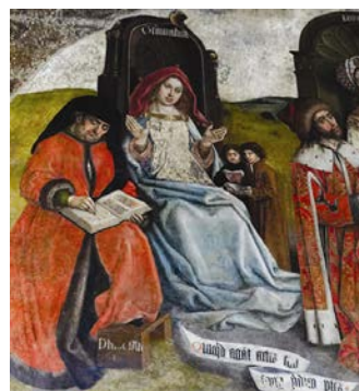
Représentation des arts libéraux de la cathédrale du Puy où la grammaire dicte son enseignement en chaire, pendant que Priscien, assis à sa droite, en prend note.