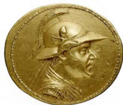
Pièce d'or de 20 statères d'Eucratide, vers 150 av. J.-C., Bibliothèque nationale de France, département Monnaies, médailles et antiques, E 3605.