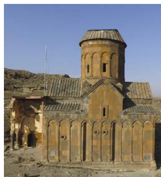
La façade sud de l'église Surb Grigor, dite de Tigran Honenc'.