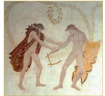
Dispute de la lyre entre Hermès et Apollon, péristyle de la Villa Kérylos.