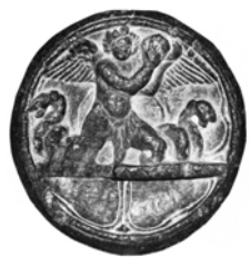
Palette du Gandhāra figurant un anguipède ailé (Peshawar, coll. partic.).