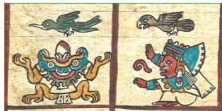
Détails du texte de la pyramide de Pépy I er à Saqqarah et du Codex Borbonicus de la Bibliothèque de l'Assemblée nationale (Paris).