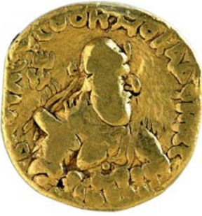
Statère de Wima Kadphisès Trésor de Pipal Mandi (note d'information d'O. Bopearachchi).