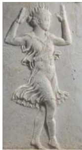
Base de candélabre du Louvre, face B. Danseuse de calathiscos , détail. Article de H. LAVAGNE.