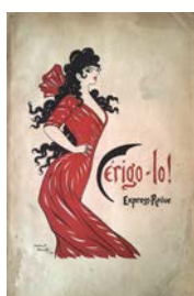
Couverture de Maurice Feuillet de la plaquette publiée par Théodore Reinach Cérigo-!o! Express-revue, 1904.