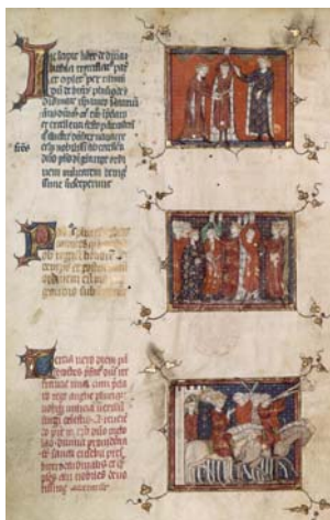
Fête de la chevalerie des fils de Philippe le Bel (juin 1313). Les trois rois : Philippe le Bel, Édouard II d'Angleterre et Louis de Navarre. BNF lat. 8504, fol. B v° (détail).