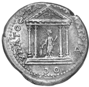
Hiérapolis Comana, 128-138, tridrachme. Berlin collection Löbbecke © Reinhard Saczewski.