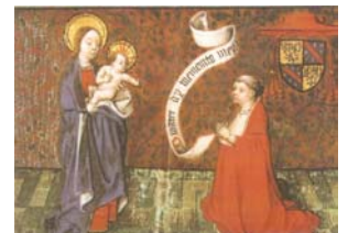
L' Imago mundi . Cambrai, Bibl. mun., ms 954, f. 1 ra.