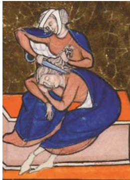
Psautier de Saint Louis, Paris, vers 1260-1265 (Paris, BNF, ms. lat. 10.525), fol. 61 v°, Samson et Dalila.