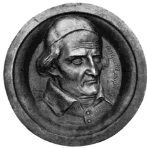
Portrait posthume d'Anquetil Duperron, médaille de David d'Angers, musée d'Angers.