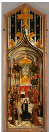
Panneau d'un triptyque commandé par la confrérie du Puy Notre-Dame d'Amiens attribué au maître d'Antoine Clabault. Le couronnement du roi Louis XII entouré des douze pairs de France. Musée de Cluny-musée national du Moyen Âge, Paris, Cl. 822a.