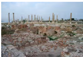
Mission archéologique de Tyr : le bloc thermal, vers l'ouest, et la basilique thermale.

Chaque vendredi, après la lecture des communications patronnées par des membres de l'AIBL, des monographies, relevant des domaines de compétence de l'Académie et jugées dignes d'intérêt en raison de leur valeur scientifique, sont portées à la connaissance de la Compagnie à l'occasion d'une brève présentation argumentée. Cette information constitue l'étape préliminaire à la suite de laquelle les ouvrages distingués, grande salle des séances, peuvent ensuite être soumis au jugement de la commission de prix appropriée de l'AIBL en vue d'être, le cas échéant, couronnés.