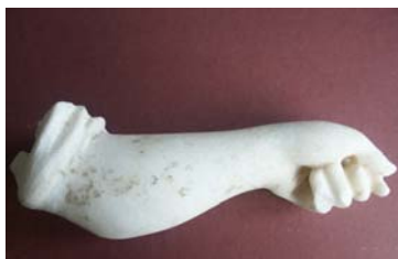
Fragment de statue en marbre (Les fouilles de Phanagorie)