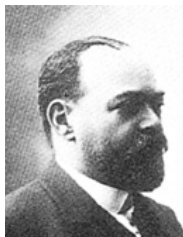
J. REINACH (1856-1921) Historien, homme politique

* Grande Salle des Séances Institut de France 23, Quai de Conti Paris 6 e Bus : 24, 27, 39, 95 Métro : lignes 4, 7, 10