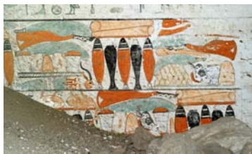
Décoration peinte du caveau de la prêtresse d'Hathor Ankhnespépy (Saqqâra)