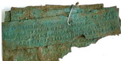
Sept plaques percées par un fil de bronze (Nouvelles inscriptions d'Argos)