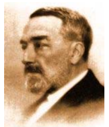
Salomon REINACH (1858-1932) Membre de l'Académie