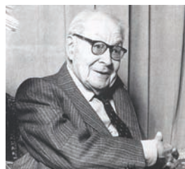
Georges DUMÉZIL (1898-1986, membre AIBL 1970, Académie française 1978).