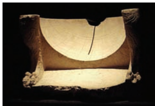
Cadran solaire hémisphérique d'Aï Khanoum (l'heure temporaire est indiquée par l'extrémité de l'ombre).