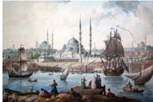
Aquarelle de J.-B. Hilair. Alliance Enchères Alençon, vente du 21 janvier 2007.