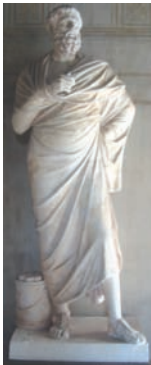
Statue de Solon, Villa Kérylos.