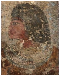
Saqqara, tombe Bub. I.19. Gros plan du visage d'Amenemwia, probablement peint par son fils.

CRAI 2007-2 (avril-juin), 600 p., 221 ill., fin mai 2009 — Diff. De Boccard, 11 rue de Médicis 75006 Paris, tél. 0143260037. Abonnement : l'année 2007 en 4 fasc. : 130 €.