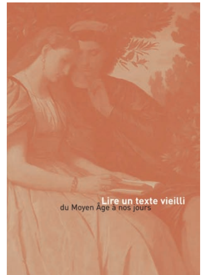
Paolo et Francesca (détail), Anselm Feuerbach, 1864, DR-Schack-Galerie, Munich. Conception graphique : mkaone@wanadoo.fr

Lire un texte vieilli : c'est ce que fait tout lecteur, dès lors qu'il lit autre chose que le journal du jour ou un roman de l'année. La distance créée par le vieillissement du texte est la première cause qui fait de la littérature une expérience du temps et un arrachement à soi-même. Cette distance, l'éditeur moderne de textes anciens peut choisir de la rendre sensible en conservant (autant qu'il est possible) la langue, les graphies, la ponctuation, la mise en page d'origine : il privilégie alors la compréhension historique. Ou il peut choisir de la réduire : il privilégie alors la relation entre le texte et le lecteur. Les littératures médiévales se prêtent tout particulièrement à l'examen des questions posées par la lecture d'un texte vieilli. Les plus anciennes écrites dans les langues européennes modernes, elles sont aussi celles qui ont offert plus tard à ces langues les cas les plus extrêmes de lecture de textes vieillis. Les attitudes diverses adoptées à leur égard sont pour cette raison révélatrices : rejet, modernisation, traduction, restitution, conservation, imitation.