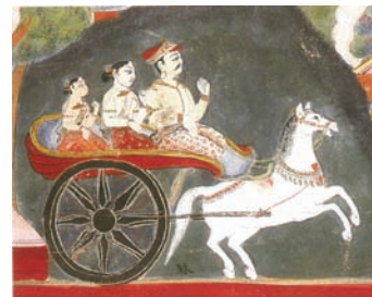
Scène 36 : Manicūda Padmāvati et Rāyanāvati partent pour la ville de Sāketa.

Vient de paraître début 2009, avec une préface du Secrétaire perpétuel Jean LECLANT , le dernier ouvrage de M. Siegfried LIENHARD , associé étranger de l'Académie : Svayambhupurana. Mythe du Népal , aux éditions Findakly – un commentaire érudit d'une peinture narrative rapportant la création légendaire de la vallée de Kathmandu. Actuellement conservée au musée Guimet, cette œuvre vigoureuse aux couleurs vives fut, dans les premières décennies du XIX e siècle, commanditée à un artiste de tradition néwari par B. H. Hodgson, correspondant étranger de l'Académie.