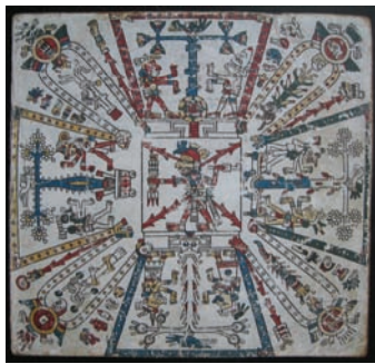
Fejervary-Mayer, p. 1 (Arqueología Mexicana 18)

Les écritures qui ont fait l'objet de ce colloque utilisent des signes qui ont une valeur sémantique (et/ou phonétique). Les caractères qui possèdent une valeur sémantique, parfois dépourvue de valeur phonétique, sont demeurés des images lisibles et reconnaissables comme telles tout au long de l'histoire de ces civilisations. Le propos de ces Actes est d'explorer cette dimension iconique et de voir comment cette dernière fonctionne comme miroir unique de la conception du monde qu'avaient en particulier les civilisations d'Égypte et de Mésopotamie (maya et aztèque) ; est également abordée, dans cette perspective, l'écriture figurative des Naxis. L'écriture chinoise quant à elle, parce qu'elle a présenté à l'origine un caractère fortement iconique, est également prise en compte, même si elle a par la suite perdu sa motivation. Loin de vouloir jeter des ponts historiques, l'ambition des études réunies dans ce fort volume, abondamment illustré, est de féconder la recherche des spécialistes de chaque civilisation par un regard croisé sur certaines remarques, questions, théories que suscite l'usage de l'image comme vecteur de sens au sein même de l'écriture.