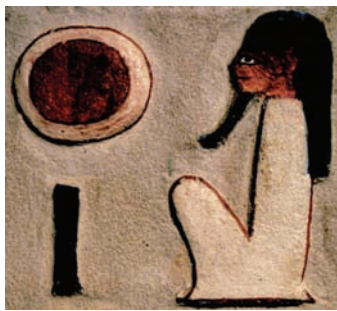
Écriture égyptienne : Rê, dieu du Soleil (exemple tiré de la chapelle d'Hathor de Thoutmosis III à Deir-el-Bahari, Nouvel Empire).