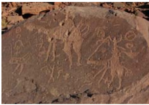
Le Darb al-Bakra : premier exemple de gravure rupestre.