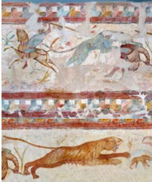
Sidret el-Balik (Tripolitaine, Libye) : paroi est, scène de chasse, II e -III e siècle ap. J.-C.