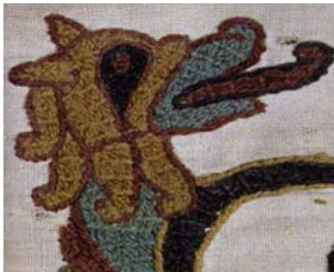
Tapiserie de Bayeux, scène 38 ; détail : la proue du deuxième navire, tête de dragon à la langue dardée.