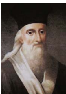
Alexandre de Rhodes S.J. (1591-1660)

Une journée d'études est proposée pour cerner l'extension et les limites de la relation culturelle et scientifique qu'ils ont contribué à établir entre les deux continents. Trois domaines offrent un intérêt particulier : étude de langues ; nouvelles connaissances et échanges scientifiques en astronomie, cartographie, histoire naturelle, etc. ; informations sur l'histoire, les littératures, les coutumes, les religions. Prenant place dans une série de réunions organisées conjointement depuis 2006 par l'Académie des Inscriptions et Belles-Lettres et la Société asiatique, cette journée entend témoigner de l'esprit commun qui les anime au service de l'orientalisme conçu de la façon la plus ouverte.