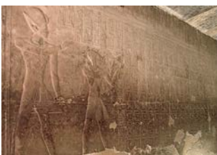
Liste des rois à Abydos