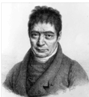
A.-J. SILVESTRE de SACY, lithographie