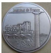
Médaille du centenaire...