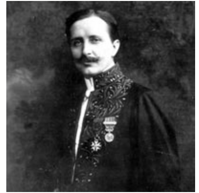
Paul PELLIOT, en habit d'académicien.