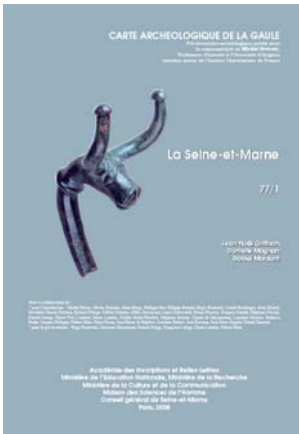
Varennes-sur-Seine, Tête de bovidé.