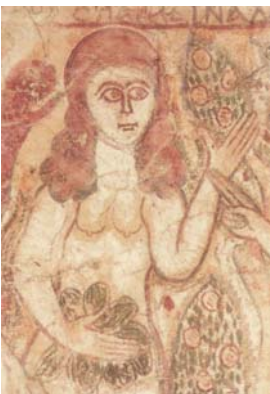
Ève au Paradis : fresque du Fayoum, X e siècle (musée copte du Caire)

Colloque AIBL/Universités Laval (Québec)/Université Paris IV/ Centre Lenain de Tillemont (Sorbonne-CNRS)