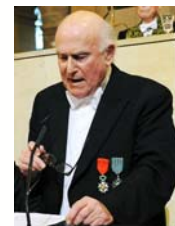
M. Glen BOWERSOCK