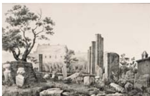
Vue de l'agora occupée par un cimetière turc ; à droite, les pilastres de la basilique, ibid. , 1867, II, pl. XII.