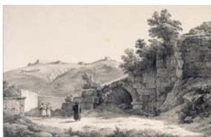
Vue du théâtre romain de Smyrne (1843), in Étienne Rey, Voyage pittoresque en Grèce et dans le Levant fait en 1843-44 , Lyon, 1867, II, pl. XI. BNF, estampes (cl. BNF).