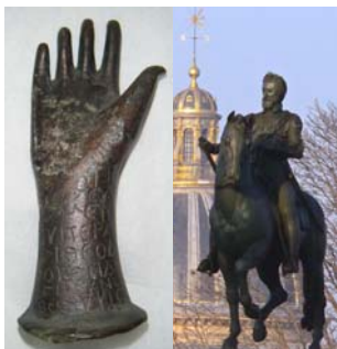
Main votive de la coll. Péretié, Musée national d'Athènes ; la statue d'Henri IV sur le Pont-Neuf, après restauration.