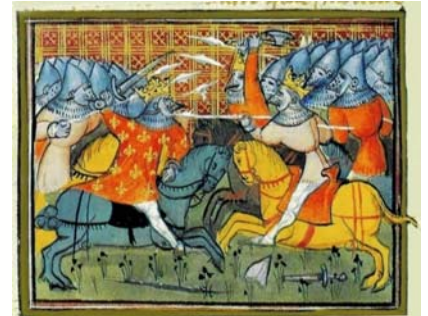
Ms. des Grandes Chroniques de France (1399) – La guerre des fils de Louis le Pieux.