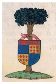
Grandes armes de frère Jean d'Aunoy (Archives nationales, S* 5432, 1512).