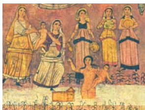
Moïse enfant sauvé des eaux. Fresque de la synagogue de Doura-Europos. Musée national de Damas.