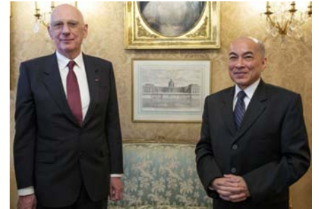
M. ZINK et S. M. NORODOM Sihamoni.

Le vendredi 24 mai 2019, s'est déroulée à l'Académie une séance thématique venue célébrer, sous le haut patronage de Sa Majesté NORODOM Sihamoni , « 25 ans de contributions cambodgienne, française et internationale à la conservation et au développement d'Angkor, patrimoine culturel de l'humanité (UNESCO) ». C'était la quatrième fois que le Roi NORODOM Sihamoni , associé étranger de l'Académie, participait aux travaux de Sa Compagnie depuis Son installation sous la Coupole le 12 mars 2010. Dans son allocution d'accueil, le Secrétaire perpétuel Michel ZINK a salué tout particulièrement le