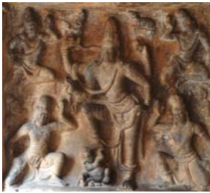
Temple de Lalitāmkurapallaveśvara, Tiruccirāppalli, relief de Śiva Gangādhara (Śiva recevant le Gange dans sa chevelure).