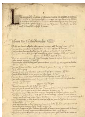
Archives nationales (France), 1345-1348, le registre JJ 269, fol. 1r.