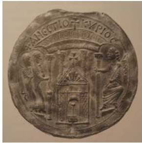
Deux saintes femmes en présence du tombeau vide que l'ange leur désigne. Ampoule de pèlerinage trouvée à Monza, fin du VI e s. © Dumbarton Oaks, Byzantine Collection, Washington, DC, BZ.1948.18.