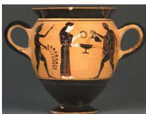
Scène culturelle et musicale. Peintre d'Amasis. 540/530 av. J.-C.