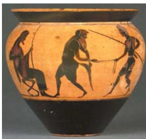
Silène captif conduit devant Midas. Groupe du Louvre F166. 530/520 av. J.-C.