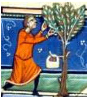
Mois de juin du Missel de Boniface VIII enluminé à Bologne par Oderisi da Gubbio au XIV e siècle (Lyon, Bibliothèque municipale, ms. 5135, f. 5v e ).