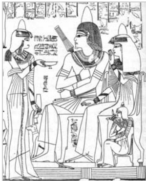
Une femme propose une coupe de vin à son époux - TT 181 d'Ipouky et Nebamon, détail.