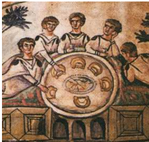
Repas funéraire. Tombe de Constanza (ancienne Tomis, Roumanie).