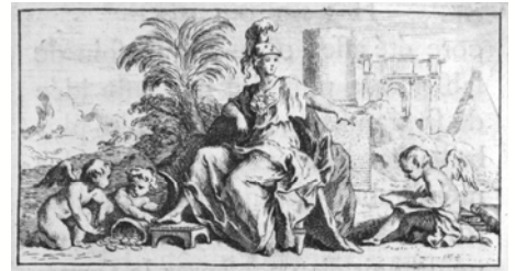
Frontispice tiré de l'histoire de l'Académie royale des Inscriptions et Belles-Lettres.

Ayant recueilli en 1683 la charge de surintendant des bâtiments, Louvois transféra au Louvre celle que l'on commençait à nommer l'« Académie des Médailles » et augmenta le nombre de ses membres, y intégrant entre autres les historiographes du Roi Racine et Despréaux, l'illustre Boileau. Sous l'impulsion du comte de Pontchartrain, secrétaire d'État à la Maison du Roi, la jeune Compagnie sera finalement hissée au rang d'institution à part entière, par une ordonnance du 16 juillet 1701 reconnaissant sa personnalité juridique ; son règlement, dû à la plume de l'abbé Bignon, lui offrit alors de solides fondations qui lui permirent de se muer sans heurts en véritable « temple de Cléo » européen. L'existence de la Compagnie devait être ultérieurement confirmée, de concert avec celle de l'Académie des Sciences, par une lettre patente signée de la main de Louis XIV à Marly en février 1713, puis enregistrée au Parlement de Paris le 3 mai 1713, il y a trois cents ans.