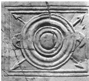
Plaque de marbre (Villa des Lecques), avec la représentation de la parma equestris (musée de Tauroentum).