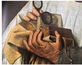
A g. : Conrad Witz, Saint Barthélemy , détail. Volet droit du Retable du Miroir du Salut, 1435 (Bâle, musée des Beaux-Arts) ; à dr. : Jean van Eyck, La madone au chanoine van der Paele , détail (mains du chanoine), 1436 (Bruges, musée communal).