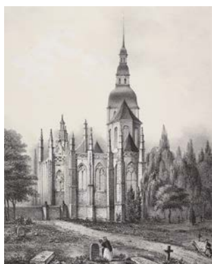
Vue du chevet de l'église Saint-Sauveur de Dinan avec le cimetière : lithographie de Hyacinthe Lorette, 1832.