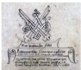
Seing manuel du notaire apostolique Louis Lydec, rédacteur de l'obituaire en 1527, f 448 v .