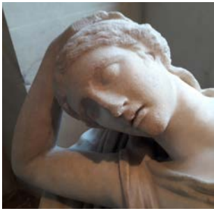
Femme endormie (détail), musée du Louvre, Ma 380.