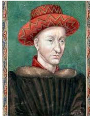
Portrait de Charles VII, d'après Jean Fouquet, Paris, BnF, Album de Gaignières, Est. Oa 14 f. 3.