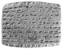
La tablette RS 92.2014, Ras Shamra, « Maison d'Urtēnu » (Mission de Ras Shamra, infographie G. Devilder)