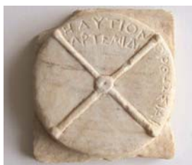
Dédicace d'Hédyton à Artémis Orthosia, BnF, n° inv. Froehner.IX.270.