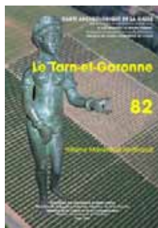
Vénus en bronze provenant du vicus de Cosa (musée Ingres, MI A 002 ; cliché H. Mavéraud-Tardiveau) sur fond de voie romaine à Varènes (cliché Vigouroux)

Carte archéologique de la Gaule , sous la direction scientifique de Michel Provost