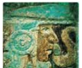
Guerrier tolèque à Chichén Itzá.

Cinq cents ans après la première mention du nom de America dans les documents géographiques (1507), la création récente de l' Institut des Amériques est l'occasion de rappeler comment, à travers les siècles, des membres et des correspondants des cinq Académies qui constituent l'Institut de France ont contribué à une meilleure connaissance du Nouveau monde. Celui-ci a été objet d'étude de la part de scientifiques, d'ethnologues, de sociologues, d'artistes, de linguistes qui ont laissé de nombreux documents dont beaucoup sont conservés à la Bibliothèque de l'Institut. L'histoire des Amérindiens est illustrée par les éditions de Codex, les grammaires des XVI e et XVII e siècles, les anciennes photographies de monuments précolombiens et autres témoignages archéologiques. Une réflexion sur quelques caractéristiques linguistiques démontre l'originalité et la richesse des langues amérindiennes.