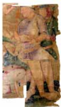
Deux dignitaires d'une peinture kouchane sur soie

Pour plus de détail > http://www.aibl.fr/fr/public/home.html (rubrique catalogue/CRAI)