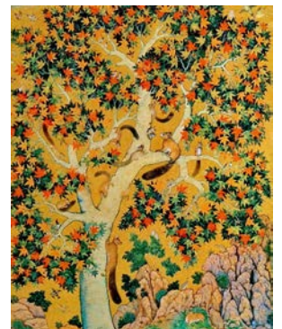
Art mogol : Abū'l Hasan & Mansūr, Platane et écureuils , 1610

L'arbre est un familier de la vie quotidienne. Il n'y a pas de vie où il n'y a pas d'arbres. Sa ramification est le symbole de la croissance. L'arbre est un bienfaiteur et un symbole de la bienfaisance. « De même que le roi des arbres de médecine guérit tous les malades qui en prennent la racine, le tronc, les branches, les feuilles, les fleurs, les fruits ou l'écorce, de même le Bodhisattva forme le vœu : qu'en entendant ma voix, en touchant mon corps, en absorbant mon sang, ma chair, mes os, ma moelle, tous les malades guérissent » ( Mahāparinirvāṣūtra ). L'arbre mérite la gratitude, l'affection des hommes. Il est un objet de culte dans toute civilisation. L'arbre dans la religion, dans les beaux-arts, en littérature, en philosophie, les vocabulaires de noms d'arbre, la médecine des arbres, l'art forestier, l'art des jardins, l'arbre est au centre de l'écologie naturelle, de l'imagination artistique et littéraire, de la religion. Toutes les disciplines, toute l'Asie sont concernées par le thème de l'arbre.