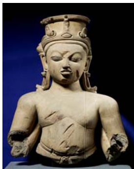
De g. à dr : Viṣṇu, Kichak, VI e -VII e siècles, terre cuite, Bangladesh National