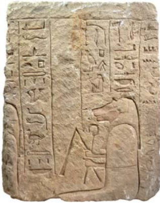
Bloc de calcaire provenant d'une tombe privée de la XXI e dynastie et employé dans la maçonnerie du tombeau de Chéchanq III, figurant une scène avec un des quatre fils d'Horus, Hapy (bloc R628).