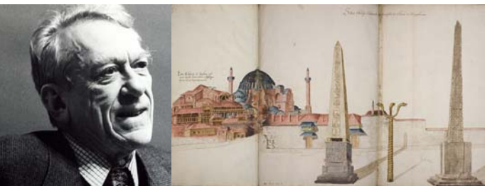
A g. : Gilbert Dagron ; à dr. : Les monuments de l'Hippodrome de Constantinople, album Freshfield (1574), f. 20.

Pour en savoir davantage sur ce colloque organisé avec le concours du CERCOR, du labex Hastec, de l'Institut de Recherche et d'Histoire des Textes (IRHT) et du Lamop ainsi que le soutien de la fondation Del Duca et de l'ERC > http://www.aibl.fr/seances-et-manifestations/colloques-et-journees-d-etudes-313/ .