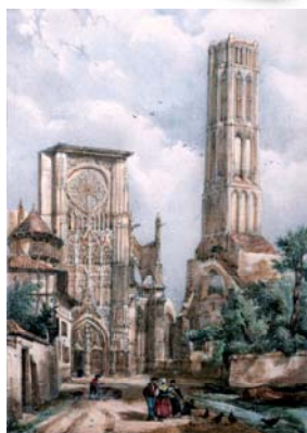
La cathédrale de Limoges, dessin de Chapuy, lithographie de A. Rouargue, dans Le Moyen Âge pittoresque , pl. 2, s. l., 1836 (coll. part.).