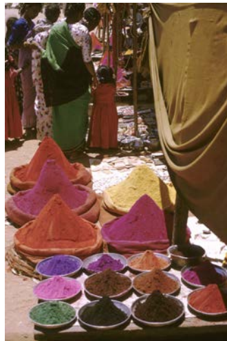
Couleurs du bon augure, marché de Mysore, sud de l'Inde