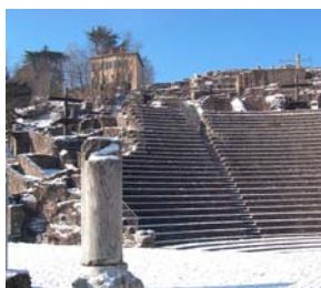
Gradins du théâtre antique, Parc archéologique