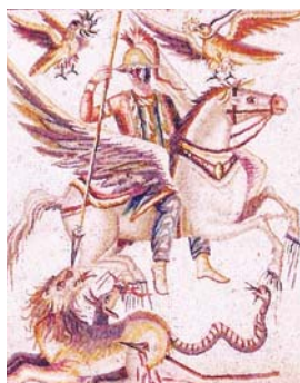
Bellérophon – figure cen- trale d'une mosaïque de Palmyre, III e siècle ap. J.-C.