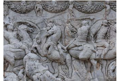
Mausolée de Glanum, scène avec cavaliers (30/20 av. J.-C.).