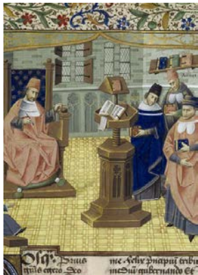
Médecin enseignant à des étudiants. A ses côtés se tiennent Galien, Avicenne et Hippocrate. Mss latin BNF 6966 (daté de 1461).

Jacques Cujas reste encore aujourd'hui l'un des plus célèbres juristes français, bien que son œuvre demeure trop largement méconnue. Né à Toulouse en 1522, il poursuit une riche et itinérante carrière de professeur de droit romain. Après avoir effectué l'intégralité de ses études dans sa ville natale, il est docteur-régent à Cahors (1554-1555), Bourges (1555-1557, 1559-1566 et 1575-1590), Valence (1558-1559 et 1567-1575) et Turin (1566-1567), et enseigne brièvement à Paris en 1576. Au cours de cette carrière ascensionnelle (qui s'achève par sa mort à Bourges le 4 octobre 1590), Cujas publie de nombreux ouvrages qui lui confèrent une très grande renommée et attirent à lui la foule des étudiants. Cette gloire est principalement due à la compréhension renouvelée des textes de droit romain résultant de l'application des savoirs humanistes à l'étude du droit. Figure de la Renaissance, Jacques Cujas apparaît, plus particulièrement, comme le principal représentant de la méthode historique au sein du courant de l'humanisme juridique.