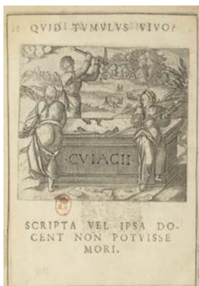
Bibliothèque nationale de France, département Littérature et art, Z-3537 (numérisé sur Gallica).