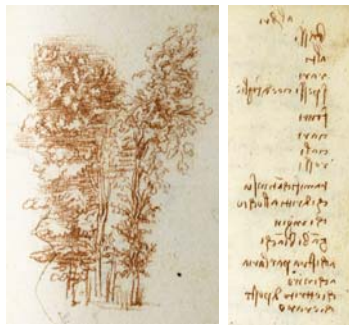
Léonard de Vinci, ms L, fol. 81 v° et 87 v°.

Retrouvez la Lettre d'information de l'Académie des Inscriptions et Belles-Lettres à l'adresse suivante : www.aibl.fr/lettre-d-information/