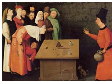
© Jérôme Bosch, L'Escamoteur (1475-1506 ?), musée municipal de Saint-Germain-en-Laye.

Pour en savoir plus sur l'intégralité du programme de ces journées d'études internationales, ses organisateurs et ses partenaires > http://www.aibl.fr/seances-et-manifestations/colloques-et-journees-d-etudes .