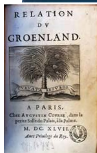
Titre anonyme pour Isaac de La Peyrère, Relation du Groenland, 1647 (Bibliothèque de l'Arsenal, 8 o -H-16732).