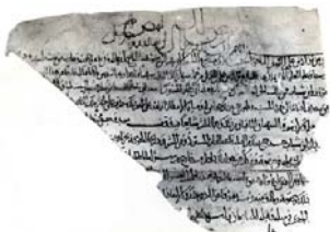
Achat de la moitié d'une dār à Damas (2 e quart du VI e /XI e s.).